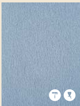
REVOTEX granallado fino