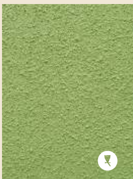
REVOTEX granallado mediano